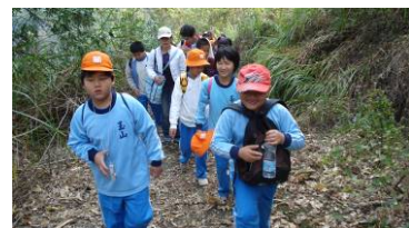
烏山大探索，緬懷先人勇！