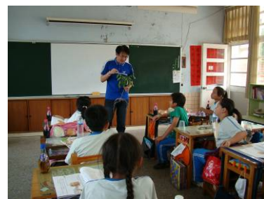
老師介紹烏山常見的植物