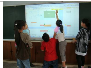
模擬虎頭山攻防戰中