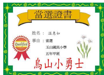
「烏山小勇士」當選證書

KEY WORDS：1. 教學主題：烏山、日治時期 2. 創意方式：資訊融入 3. 創意成效：烏山小勇士