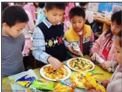
圖 20：創意 buffet 準備