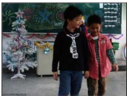
圖 23：星光大道秀創意服裝