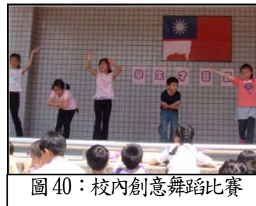
圖 40：校內創意舞蹈比賽