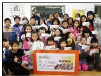
圖 34：只要努力，人人都可以是百萬大富翁