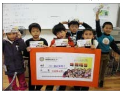
圖 33：我的第一個壹百萬