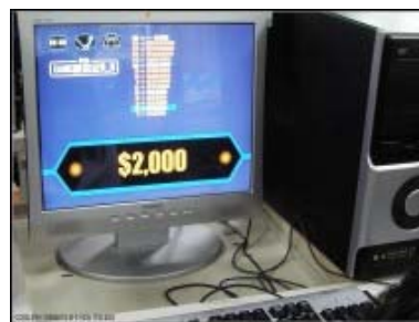
圖 3：百萬富翁線上評量