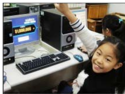
圖 31：一次次練習，我也過關了！