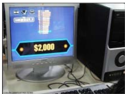
圖 29：百萬大富翁程式