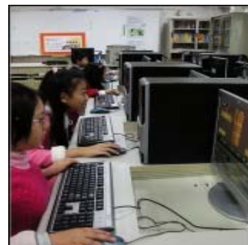
圖 38：無畏挫折、自我挑戰

將課程結合時下小朋友喜愛的百萬小學堂遊戲方式，設計出「舞林百萬大富翁-線上總評」的遊戲評量方式。題目內容不但有每個課程的複習，也有延伸的兩性問題，冀望每位同學都能勇於挑戰自己、無懼挫折地一試再試，最後人人都能成為百萬得主。