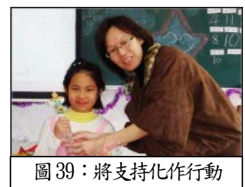
圖 39：將支持化作行動