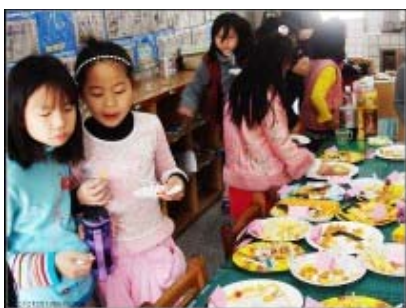
圖 26：模擬 buffet 用餐