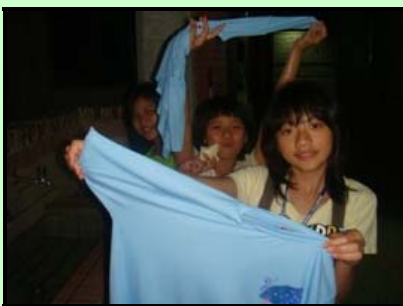
▲自己的衣服自己洗