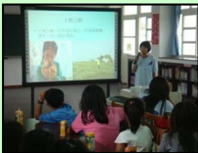
▲自己上台分享紫蝶簡報