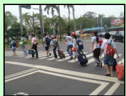
▲自己拉著行李往返各地