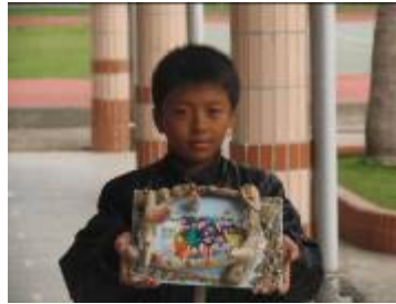
(把海洋的素材點綴的多彩多姿，記憶將更美好)