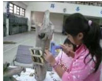
(學生發揮團隊精神專注的創作)