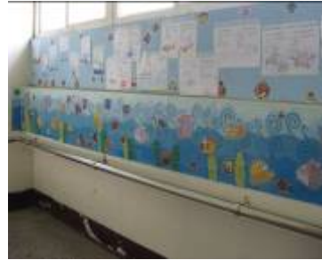
(圖書館紙雕貝殼標題)(海洋主題學習步道)