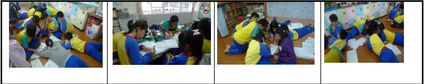
↑ 改編高手：小組盡情以腦力激盪來討論。