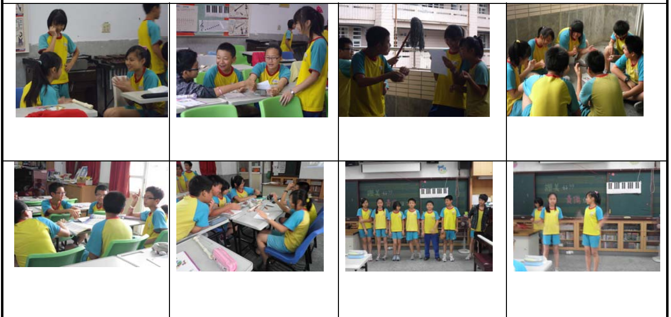
↑ 分工合作：小組討論歌詞改寫與分組發表。