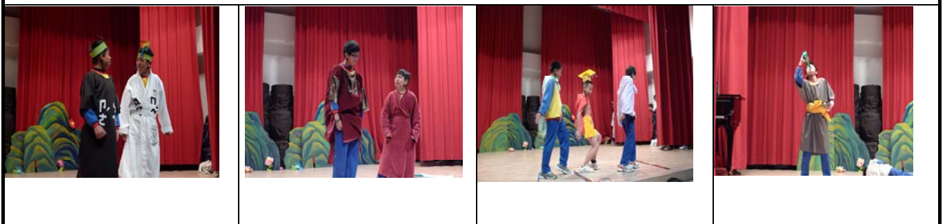
↑ 人人都是大明星：戲劇表演結合學校特色「錦興之星」班級秀。