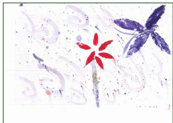
葉脈拓印藝術創作（紹慈作品）