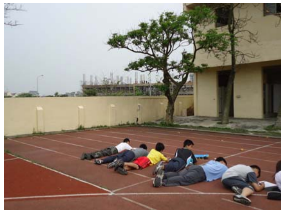
在自由的環境中進行珍樹寫生