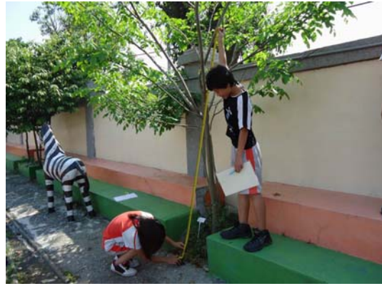
學生結合數學領域知識實際測量樹高