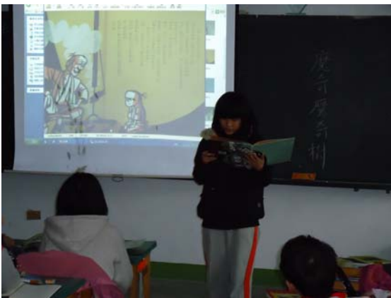
摩奇摩奇樹故事欣賞及心得分享