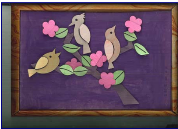
樹的多層次組合藝術創作（冠妤作品）