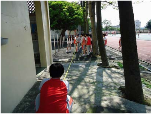
學生透過影長測量樹高

(三) 珍藏~相約到永久：透過藝術創作呈現學生學習成果，並透過同儕觀摩方式，提昇創作的品質。