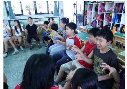
【全班性的表演練習】：大家一起來模仿，說英語我不怕。