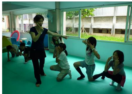
【英語表演課的小組即興演出】：發揮想像力與創造力，磨練溝通能力。