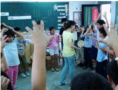
【英語課的暖身活動】：學習先放鬆，才能專注在喜愛的活動中。

將創作性戲劇教學方法運用在藝文與英語跨領域課程統整的行動，為使學生在英語學習興趣與聽、說能力提升之外，在戲劇活動進行的過程中獲得的體驗與開發的潛能面向更廣泛。