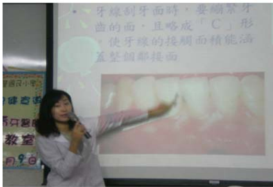
牙醫師講解口腔衛生相關知識

請學生相互記錄潔牙情況，並拍下組員正確的潔牙方式。請家長協助拍下在家的潔牙狀況，與看牙醫的情形。小組相互勉勵，確實執行口腔衛生學習護照之內容。