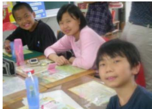
學生檢查並記錄牙菌斑多還是少