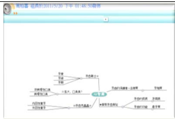
小組合作完成心智圖