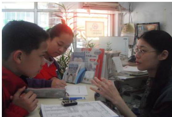
學生設計教學主題採訪牙醫師