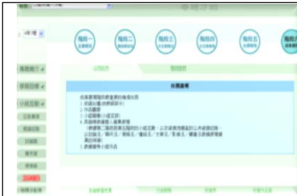
小組合作學習平台