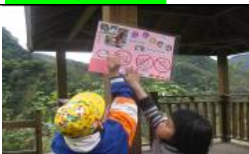
承諺說：把標誌貼在涼亭上觀光客會看到。