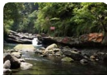
日夜唱歌陪伴我們的宇內溪。

義盛國小附幼位於復興鄉「小烏來風景區」，從眾多的峽谷地形蜿蜒出一條美麗的宇內溪。宇內溪是小烏來瀑布的上游，屬於水質保護區，豐沛的溪水除了供應部落居民的飲水外，還滋養最具有泰雅精神的「苦花魚」。宇內溪潺潺之聲，終日縈繞在幼兒的耳邊，是那麼的自然、親切。然而隨著小烏來空中步道的崛起，大量觀光人潮改變了部落生態，首當其衝的就是一美麗的宇內溪受到波及。為了讓部落的幼兒去感受四周的環境，於是我們的課程就從幼兒熟悉的場域~宇內溪展開了。