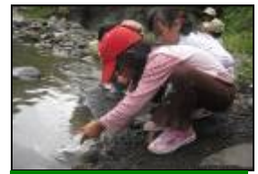
採取行動來拯救生病的蝌蚪。