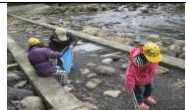
幼兒們在宇內溪旁撿了很多香菸頭。