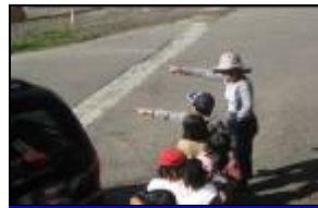
幼兒說：廁所再過去再直直走就有涼亭可以休息。