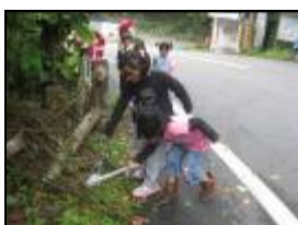
幼兒看到校門口前的垃圾會想辦法撿拾。

發現幼兒已將撿拾垃圾的習慣，慢慢應用在操場與學校的四周圍，只要有空瓶鐵罐，幼兒已會主動想辦法把垃圾做資源回收；在檢驗溪水所使用的放大鏡經驗，幼兒會應用放大鏡來觀察教室內外的昆蟲生物；幼兒也將學習到的認知概念應用在小小宣傳單的製作上，例如幼兒會主張宣傳單要有不可以跳水、不可以抓苦花魚等，也能把對國小生宣導的經驗，應用到向路人發送宣傳單時的互動與表達。