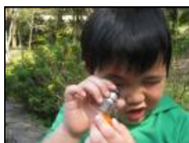
應用放大鏡來觀賞四周的景物。