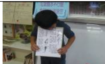
立夫說：有髒髒的蟲在石頭，宇內溪有一點髒。