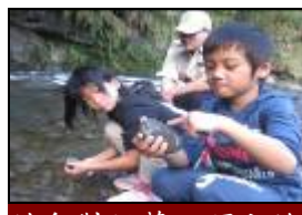
幼兒對附著石頭上的生物表達心得。