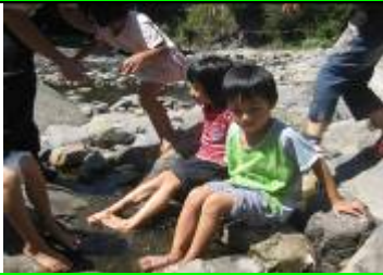
承諺分享：水很冰、很舒服。