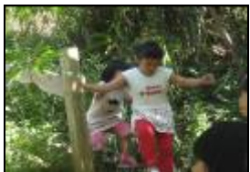
協調移動身體在大自然中探索觀察。

觀察到幼兒在溪邊或在不平路面都能平穩協調身體的移動性動作進行探究；也能運用肢體進行苦花魚扮演遊戲；更能使用工具來撿拾垃圾；且在模擬路線或是在積木角、美勞角所建構出宇內溪與水管的情景都發揮到創意的美感；也看到合作海報的創意技能；上台宣導更需要能以合宜的聲量、儀態來表現。