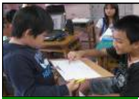
我會主動問哥哥有關苦花魚的問題。

在苦花魚探究調查中，幼兒學習問問題，再透過提問、紀錄、統整、分享與聆聽來建構對苦花魚生態的了解；為了澄清蝌蚪長大是苦花魚的預測，就從飼養蝌蚪中探究到蝌蚪生長的變化並比較出盆水、溪水對蝌蚪生命的影響，甚至採取果斷的行動來挽救快奄奄一息的蝌蚪。