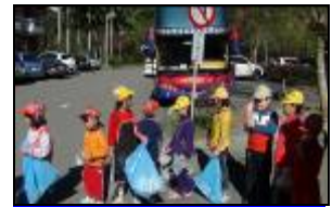
遊覽車在後面，我們學校在前面又高高的地方。