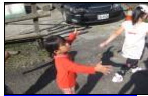
幼兒說前面比較低走下去往那邊指左手處就到宇內溪