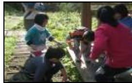
大班照顧並帶領中班進行撿拾垃圾。