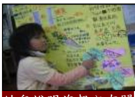
幼兒說明海報內有關苦花魚的生態內容。

不論是苦花魚生態調查後資料整理的分享還是 ppt 宣傳內容的說明，都促使幼兒從探索建構的認知能轉換成口語的表達；幼兒也藉由回顧活動的表達而展現出記憶力與統整力。