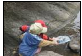
幼兒採取行動把溪邊垃圾撿起來。