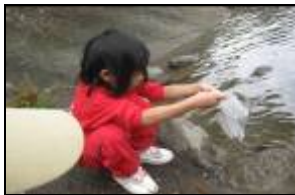
蝌蚪生病了，趕緊把蝌蚪放回溪水邊。

幼兒能從飼養蝌蚪中同理到蝌蚪需要溪水，趕緊把蝌蚪放回溪內；幼兒也能關懷苦花魚與溪裡的動物，認為如果溪水髒了，生物會死掉；也體會到泰雅族人與苦花魚共存的智慧而感到光榮與認同；幼兒更凝聚對部落的情感，採取行動為部落溪水的乾淨而努力。