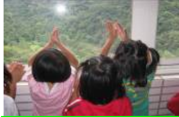
樓上圖書館也看到宇內溪。