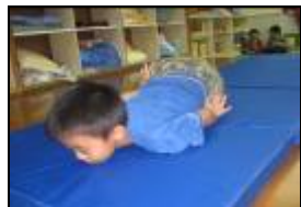
我是勇敢往上游的苦花魚。