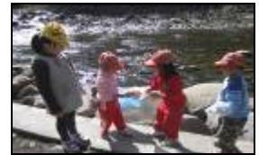
我撿垃圾不怕苦要像苦花魚勇敢。