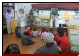
幼兒對家長宣導要愛護宇內溪不行丟垃圾