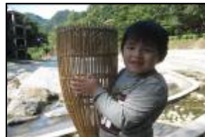
以前的阿公寶貝小魚可以從魚簍的洞溜走。