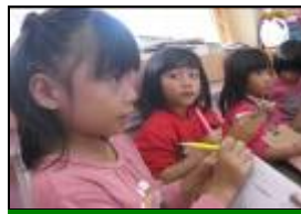
我畫下哥哥說苦花魚沒有手的事。