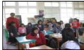
能自信上台對國小生進行宣導活動。