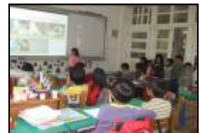
幼兒用合宜的聲量與儀態向哥哥姊姊宣導