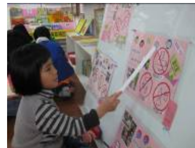
玫瑰邊看標誌邊說明

【慈恩的話】 如果水髒了，苦花魚、蝦子、蝌蚪就會死了，水裡面就沒有魚和蝌蚪，動物很可憐，我們也很可憐，就沒有乾淨的水喝了，要貼標誌不可以丟垃圾。