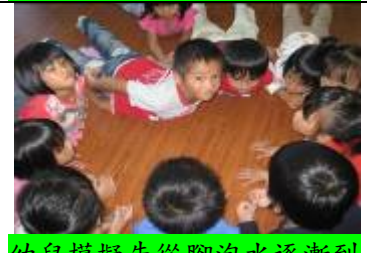
幼兒模擬先從腳泡水逐漸到心臟的動作以適應溪水溫度。