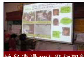
幼兒透過 ppt 進行回顧與統整活動。