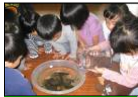
幼兒探究到盆水與溪水對蝌蚪生命的影響