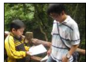
幼兒送宣傳單給客人並與客人互動及說明