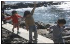
幼兒對宇內溪產生情感會說出感謝的話。

幼兒愉悅專注在溪邊探索，並說出感謝的語；小組活動大班會帶領中班進行撿拾垃圾與紀錄的工作；幼兒能自信勇敢上臺對著國小哥哥姊姊宣導，請加入環保小尖兵的行列更是感到無比的興奮與自我肯定；幼兒會以苦花魚的精神為榜樣，表達出我不怕苦要像苦花魚勇敢。