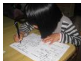
幼兒運用習得概念來製畫宣傳單。