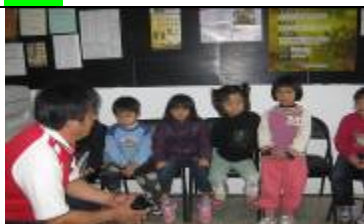
村長說我們可以去貼不行丟垃圾的標誌。