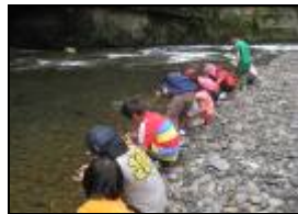
幼兒認為溪水髒了水裡的動物會死。