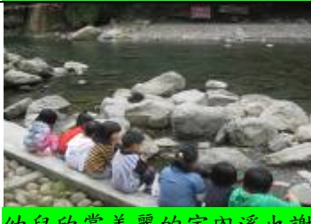
幼兒欣賞美麗的宇內溪也謝謝宇內溪。