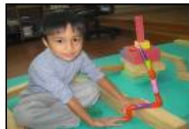
用教具建構出一條水管把溪水引到我家。