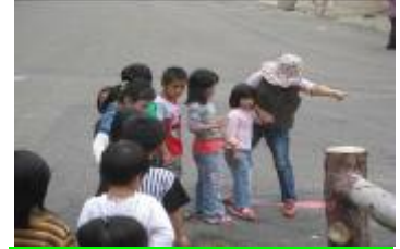
玟瑄帶大家到宇內溪探索。