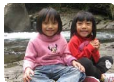
我們是保護宇內溪的小勇士。

實踐在地本位課程，以幼兒熟悉部落情境出發，作為課程設計的基礎與準備。課程前的準備有勘查溪水地形、運用國小部與部落可用資源、拜訪社區耆老牧師、專業諮詢、幼兒起始行為的了解、老師的討論、主題網的雛形架構。在課程實施歷程中，順應幼兒的興趣與發現，再做活動的調整與修正。