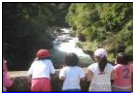
幼兒認知到溪水是從前方高高處流下來。

多次外出從不同的路線探訪不同段落的宇內溪，進行溪水檢測、撿拾垃圾與各式調查活動，幼兒對於社區地貌、景物、建築及公共設施間的相對位置有更深刻的體認，不只能夠以方位詞帶路，也能夠透過口語描述景物建築間的相對位置。