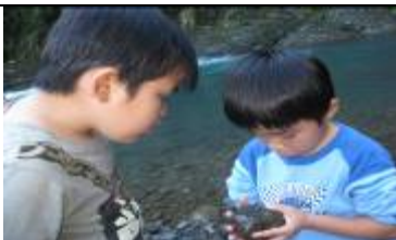
幼兒翻找石頭有沒有浮游生物。