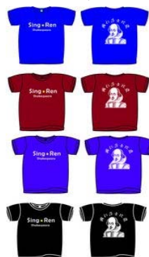
【興仁莎士比亞－畢業展演之戲服】