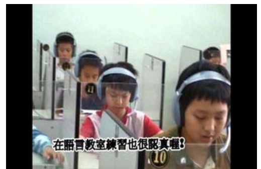
【《羅密歐與茱麗葉》劇本口試---語言教室篇】