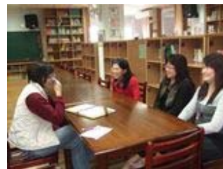
【與家長有約—家長分享對英文展演的想法與意見】

有些家長們一開始聽到要以表演方式來呈現英語成果時，會持著懷疑的態度，孩子們辦得到嗎？會不會影響課業？這些問題在看到孩子們的學習態度改變而慢慢消失，學生會利用課餘的時間練習英語對話或歌曲，有時會相約上網一起分享英語歌曲，家長們認為孩子能主動學習英語是很難得的，也很願意協助相關事項，包括協助展演工作進行、學生接送及材料支援等。在展演過後，家長也會主動提供意見與回饋，作為日後教學精進的參考。