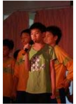
【瑞浩在《羅密歐與茱麗葉》