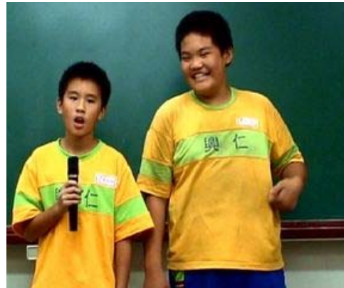
【 學生上台口頭報告, 並現場演唱】