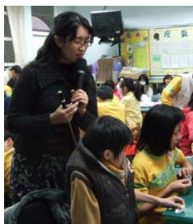
【課堂上師生互動討論】