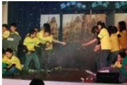
【畢業公演劇照之二】