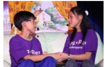
【畢業公演劇照之三】