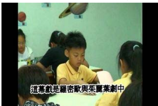
【《羅密歐與茱麗葉》劇本練習--課堂篇】