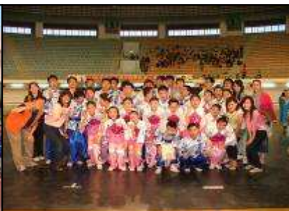
全國民俗舞蹈比賽