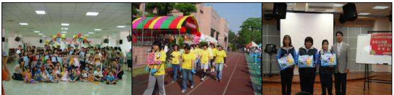
國小部融合班開學