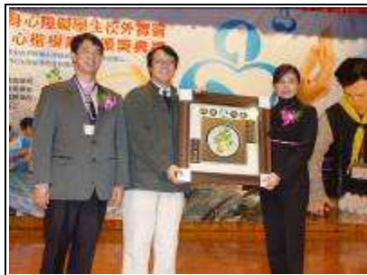
愛心楷模廠商表揚

結合鄰近學校暨社區資源，擴大學生融合機會，爭取民間社團支持，加強校際間的合作，落實高中職社區化合作機制，謀求學校與社區的共利共生、共榮共存；並透過國際交流，發展與世界同步的國際胸懷。