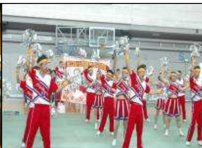
中南區啦啦隊比賽