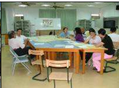
期初召開 IEP 會議