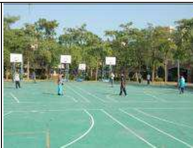
教師指導同學壘球技巧