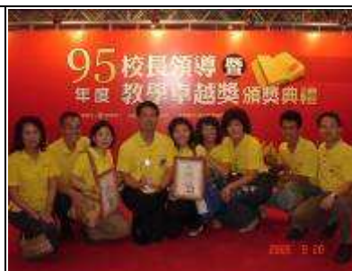
95 年度教學卓越金質獎