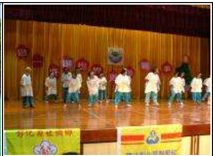
住宿生同學參與晚會表演