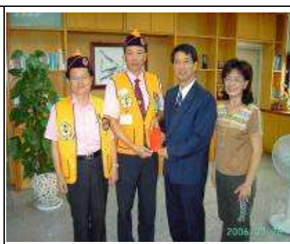
獅子會蒞校致贈獎助學金