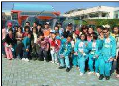
畢業班學生畢業校外教學