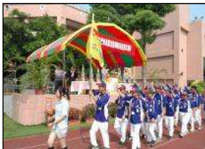
台灣區智能障礙者壘球賽