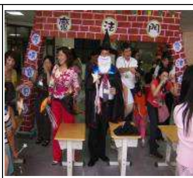
魔法門開啓-開學囉