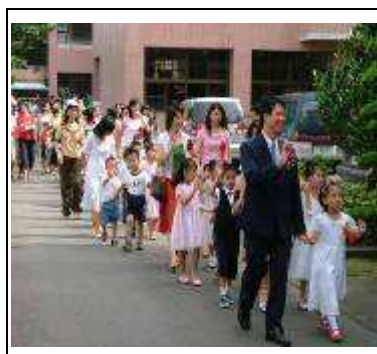
小小畢業生校園巡禮

讓身障生回歸社區是啟智教育的重要目標，所以融合教育遂成為特殊教育的主流，因輕度學生安置於高職特教班，使得特殊教育學校中、重、極重度的學生在學習上缺少了模仿對象，楷模的呈現會激勵更多的學習動機，於是本校在經過民主正規的程序下成立了國小部暨高職部幼保科融合班，祈使普生能發揮功能，並提供特生更多的協助資源，期能由這些融合家長、學生，散播融合理念的種子。