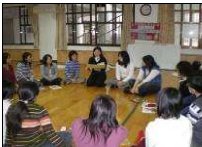
繪本在戲劇教學上的運用