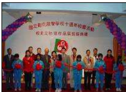
十週年校慶活動啓用校史館