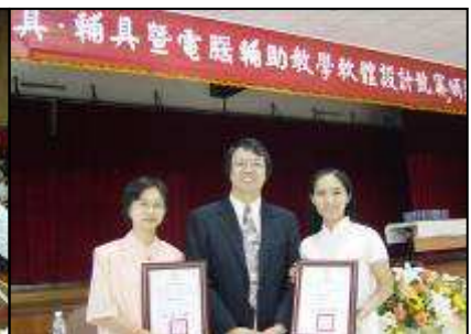
教材教具得獎頒獎