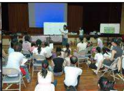
繪本在教學上的應用研習