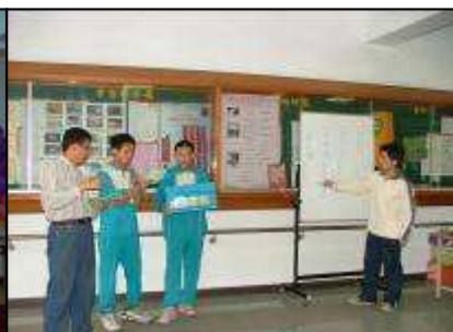
模範生選舉競選活動