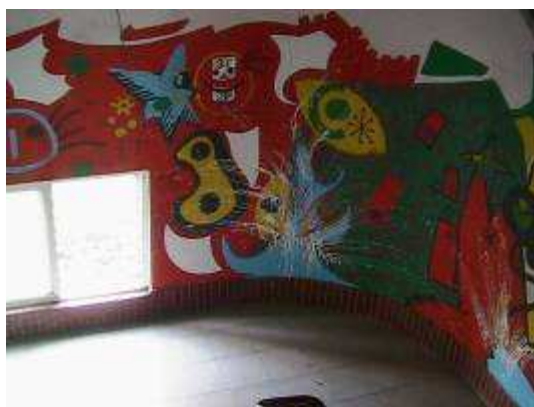
圖 11-藝術階梯的創意彩繪實景