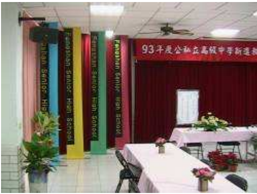
圖 56-研習會場學生設計製作現場