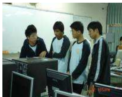
圖 38-網博學生分組製作實況