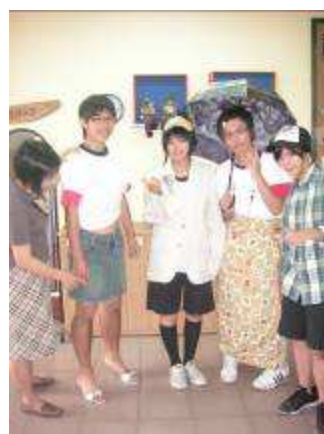
圖 43-好男好女教學實況