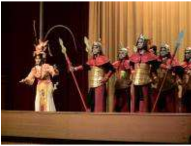
圖 49-豫劇戲碼展演實況