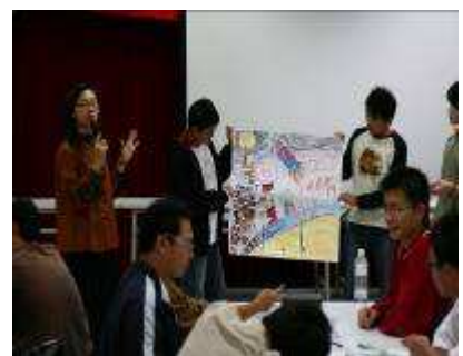
圖 07-培育營外聘講師解析學生作品