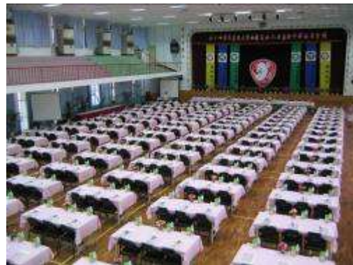
圖 53-全國高中校長會議學生設計製作現場