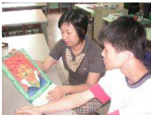
圖 60-自畫像藝術創作的方式來進行心理輔導實況

團隊成員積極與高雄市忘憂草憂鬱防治協會、高雄市衛生局心理衛生中心、高雄市自殺防治中心合作，以藝術創作的方式來進行心理輔導諮商，使教學能量得以分享，並且，更能提昇教師在藝術領域的班級經營中，發現學生的個別心理問題，適時予以協助。