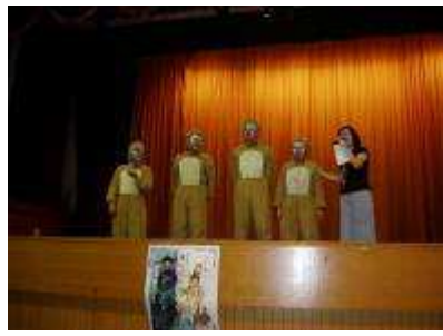
圖 50-創作劇碼展演實況