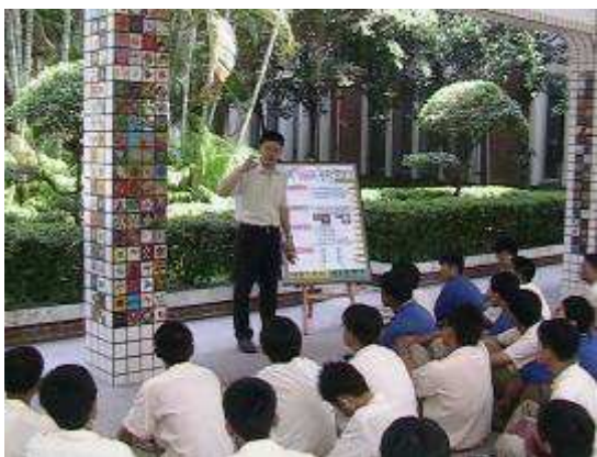
圖 14-藝術長廊環境裝飾藝術課程成果發表實景