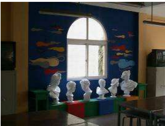
圖 08-美術教室創意彩繪實景