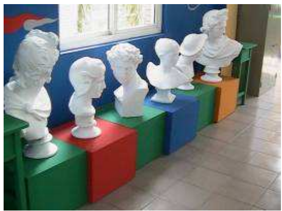
圖 09-美術教室創意彩繪實景