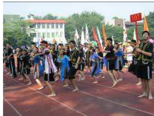
圖 59-學生運動會創意藝術化粧進場及表演