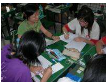
圖 33-語文領域專題翻譯討論實況