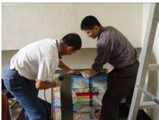
圖 16-變幻彩裝馬賽克藝術佈置實景

出深具創意的馬賽克藝術作品，並將作品結合行政大樓的走廊環境，將學生作品發表展覽並活化校園的人文氣質。