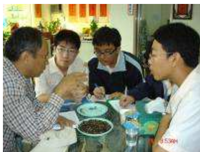
圖 31-專題研討校外採訪撰寫實況