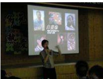
圖 05-培育營外聘藝術專家指導

(7) 行政處室合作 ：與行政處室合作，完成研習會場藝術佈置，使原來僵化的研習會更能擁有一股藝術感性的味道；另外，積極配合輔導室，針對學生做藝術創作輔導剖析諮商之協助。