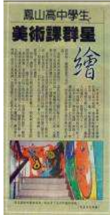
圖 65-美術課群星繪-自由時報