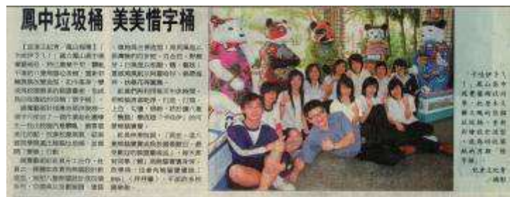
圖 68-鳳中垃圾桶美美惜字桶-聯合報