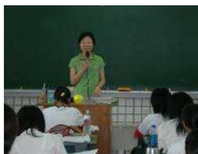
圖 35-語文領域教學實況