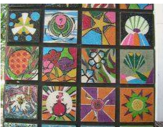
圖 15-藝術長廊環境裝飾藝術實景