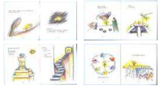
圖 63-配合高市自殺防治中心製作藝術刊物