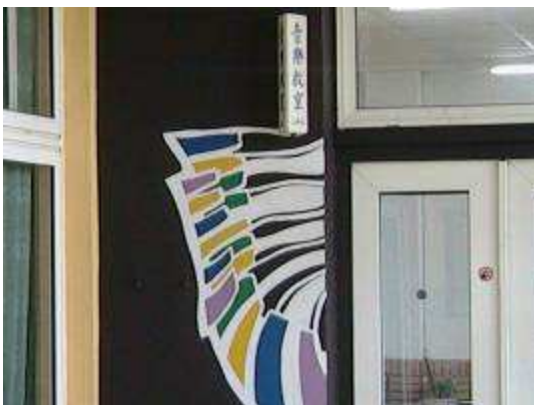
圖 13-音樂教室的創意符碼實景