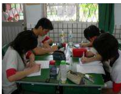
圖 34-專題翻譯分組討論實況