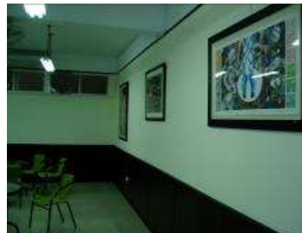
圖 22-合作社的色彩魅力入口意象