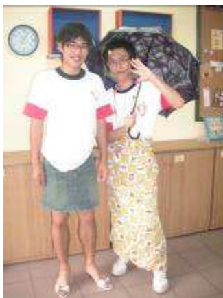
圖 41-男學生扮女裝實況