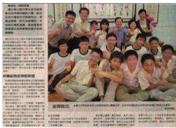
圖 70-國際網博鳳中首戰奪金-中國時報