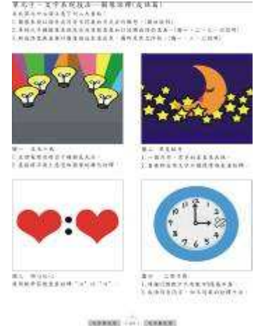
圖 48-文字萬花筒創意教材