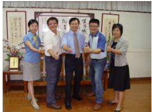
圖 01-看見藝術-創意鳳中教學團隊合影

(五) 團隊簡介：「看見藝術-創意鳳中」本團隊是以藝術領域教師為主軸，並結合資訊、外語等專長教師，及融合教學與行政資源之統整，是一跨領域的整合型團隊。而在團隊教師群中各有專精，其中更有榮獲國際大獎的國際級競賽選手，在大家同心協力之下，活化教學模式，開發創意課程，相互學習支援，讓教學成效得以發揮。本案之教學成果豐碩，首先讓學校校園不但充滿藝術氛圍，更使學生紓發藝術感性的情懷於空間的營造上；另外，更積極指導學生參加校外競賽榮獲佳績，塑造孩子們的成就感與自信心；再者，跨領域的相互結合，更讓國際競賽成果得以傲人。這些努力，都是為了讓學生從藝術環境的境教中，逐漸的感受創新的新活力，讓年輕的心更能展現光與熱。(圖 01)