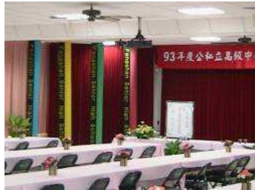
圖 57-研習會場學生設計製作現場