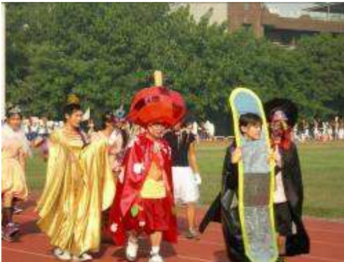
圖 58-學生運動會創意藝術化粧進場

本校學生在深具藝術氛圍的校園中生活，似乎已內化為一種特質，在學校運動會進場時則展現出藝術涵養，以創意的藝術化粧進場作為另一種表現，其表現相當多元，造成藝術創意的風潮。