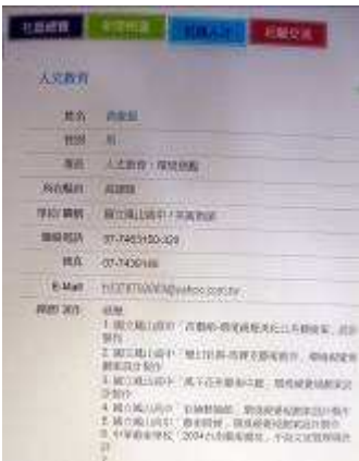
圖 64-榮登社區通社造人才-高縣官網

本團隊的方案教學活動，在配合報章媒體的宣導之下，讓藝術氛圍的分子散播到社會人民、社區鄰里，讓環境藝術的「創意境教」和「藝術活力」等議題藉以宣導推廣，提高教學成果的推廣性。因而團隊教師更榮登行政院文化建設委員會-台灣社區通社造人才資料庫彙刊，以利未來更便於推廣環境藝術的概念。