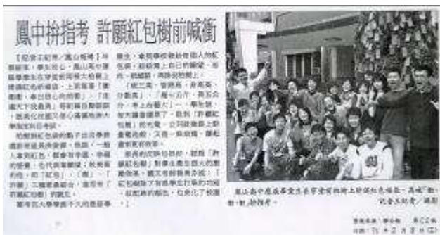
圖 72-鳳中拚指考許願紅包樹前喊衝-聯合報