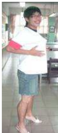
圖 42-男學生扮女裝實況