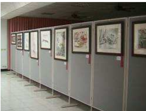
圖 54-校務評鑑會場學生設計製作現場