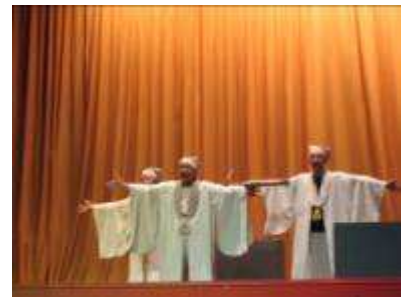
圖 51-現代舞台劇展演實況