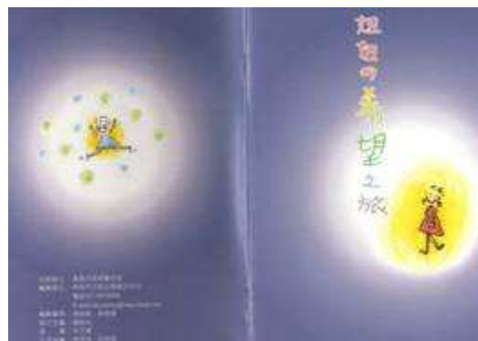
圖 61-配合憂鬱防治協會製作藝術刊物