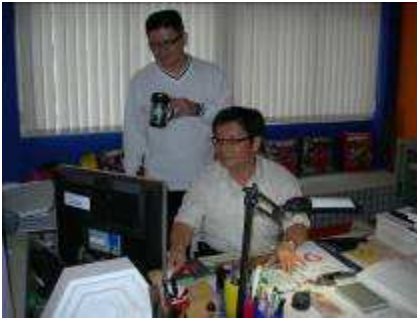
圖 02-團隊內部運作實況