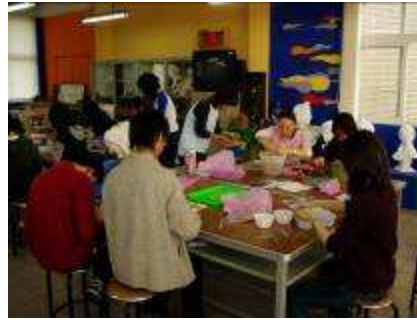
圖 03-團隊內部方案執行實況