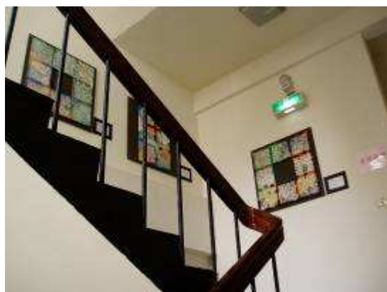
圖 17-變幻彩裝馬賽克藝術創作展示實景