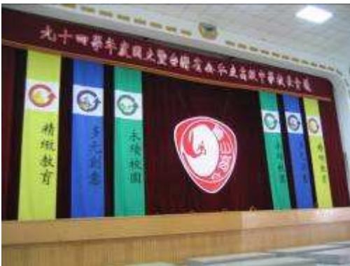
圖 52-全國高中校長會議學生設計製作現場