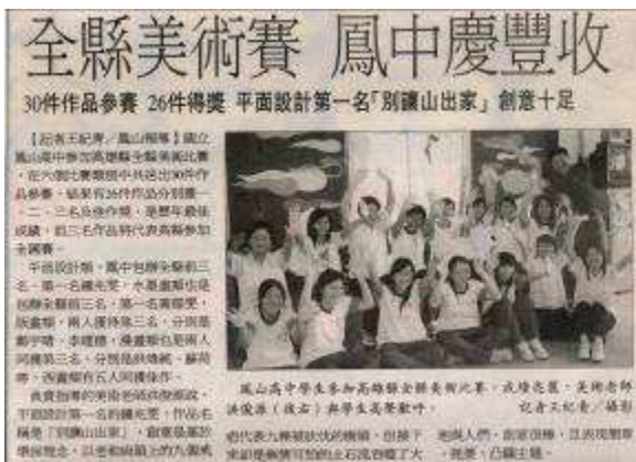
圖 69-全縣美術賽鳳中慶豐收