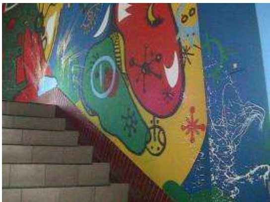
圖 10-藝術階梯的創意彩繪實景