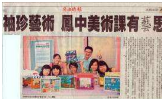
圖 73-袖珍藝術鳳中美術課有藝思-自由時報