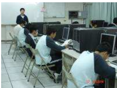
圖 30-專題研討分組討論實況