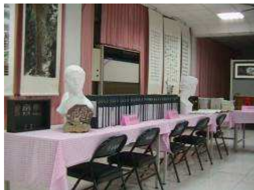
圖 55-校務評鑑會場學生設計製作現場