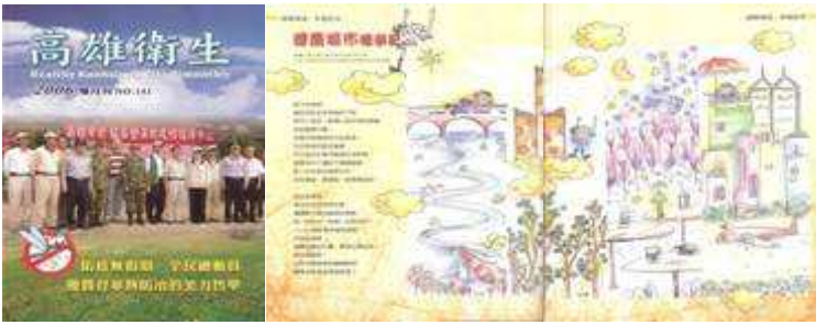
圖 62-配合高雄市衛生局心衛中心製作藝術刊物