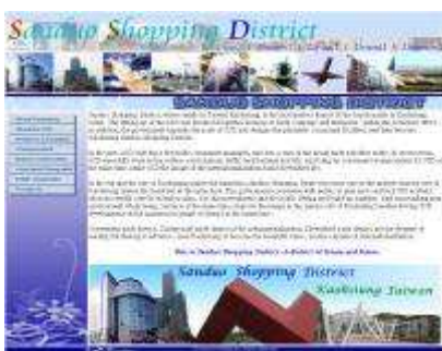
圖 36-國際網博-國際金獎作品