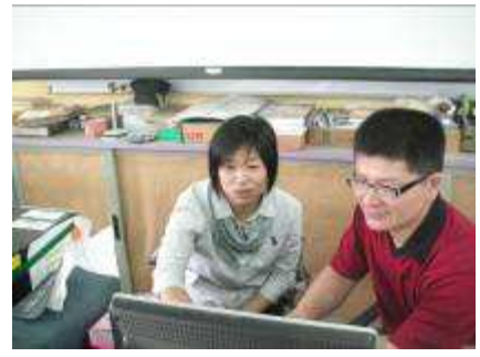
圖 04-團隊內部運作討論實況