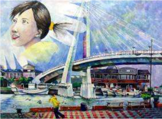
圖 25-培訓營美術優秀作品之一