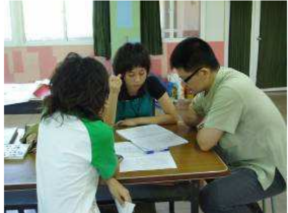
圖 26-美術培育營授課講解及創意案例討論實景