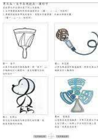
圖 47-文字萬花筒創意教材