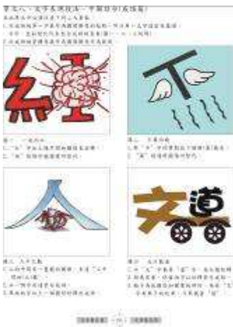
圖 46-文字萬花筒創意教材

3. 配合95年度高中職新課程，積極開發設計類創意教材，結合文學領域，以生活中的文字為設計提要，設計出深具趣味性的教材，彙整出「文字萬花筒」設計類教材設計，讓學生學習更具系統化、步驟化、趣味化等功效。