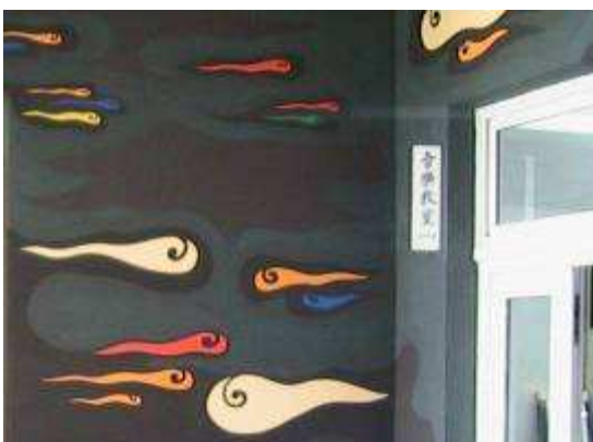
圖 12-音樂教室的創意符碼實景