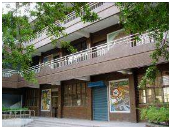
圖 19-技藝館的環境視覺公共藝術實景