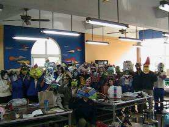
圖 44-環保面具藝術創作教學實景

2. 配合生命教育議題，在教育部生命教育融入中小學課程議題的全國教師研討會中受邀發表「環保面具藝術創作」教案，在會中教師們反應熱烈，頗獲佳評。