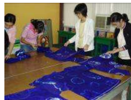
圖 06-社團指導運作實況