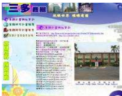
圖 37-台灣網博-全國銅獎作品