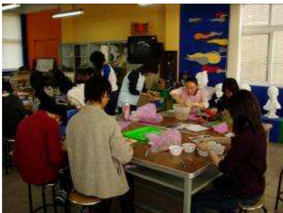
圖 18-技藝館的環境視覺公共藝術學生製作實景