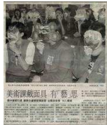
圖 66-美術課戴面具有藝思-聯合報